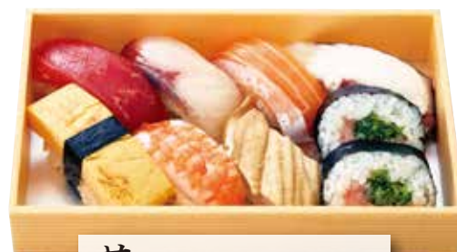
花 (一人折) 1,400円(税込)