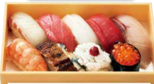
すし上盛 (一人折) 3,000円(税込)