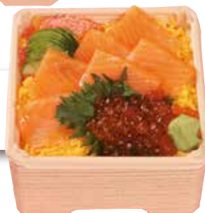
親子ちらし 1,400円(税込)