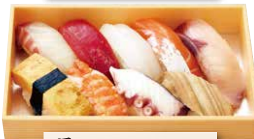
月 (一人折) 2,000円(税込)