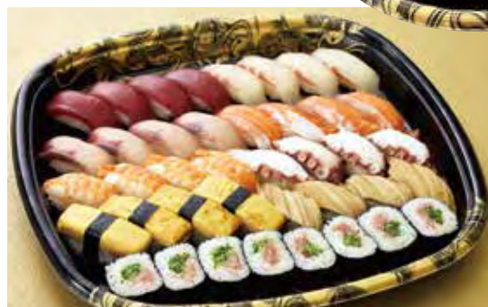
すし盛 椿 6,000円 9種40貫 つばき (税込)