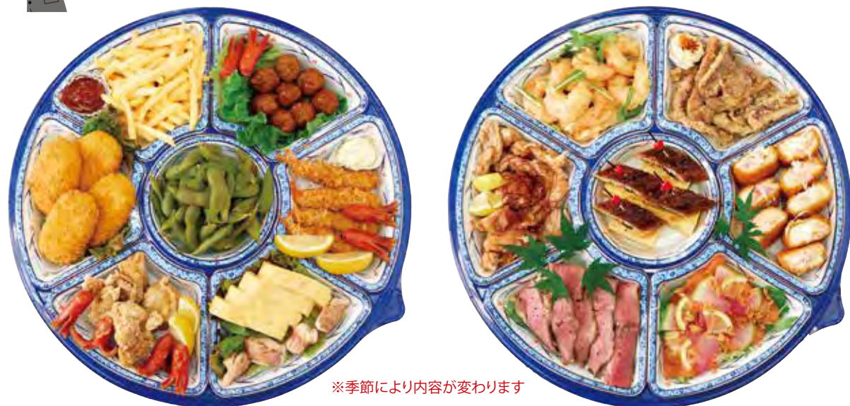
オードブルA 4,500円(税込)