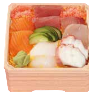
海鮮ちらし 1,400円(税込)