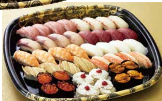
生うい とろ入 すし盛 蘭 10,000円 11種44貫 らん (税込)