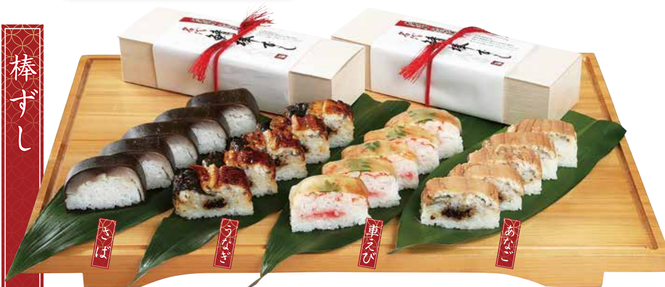
北海道産真昆布使用 鯖さば 棒ずし 5貫 1,200円(税込) 10貫 2,300円(税込)