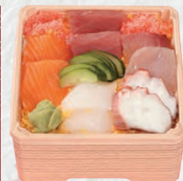
海鮮ちらし 1,400円(税込)