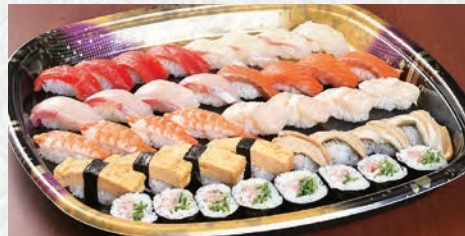
すし盛 椿 5,500円(税込) 9種40貫 つばき