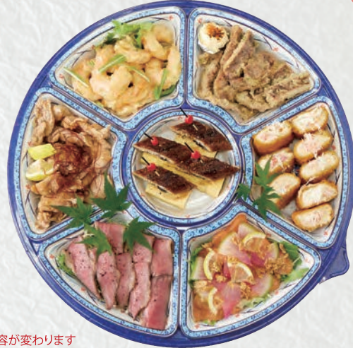
オードブルB 7,000円(税込)