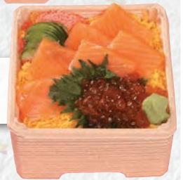
親子ちらし 1,400円(税込)