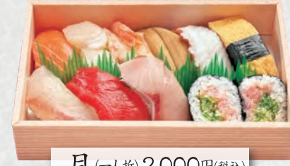
月 (一人折) 2,000円(税込)