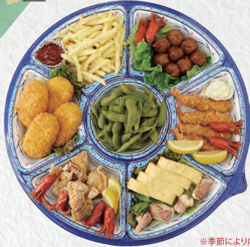
オードブルA 4,500円(税込)