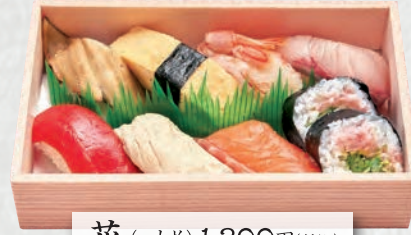
花 (一人折) 1,300円(税込)