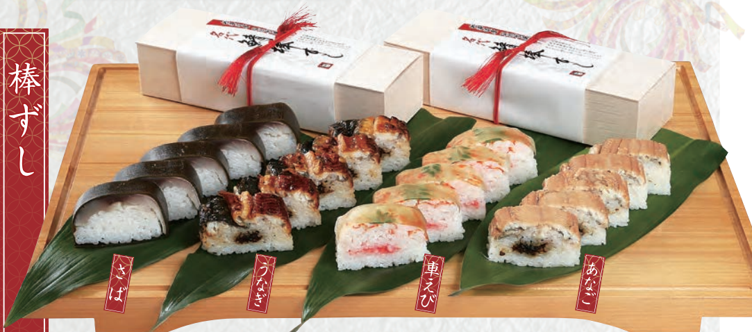
北海道産真昆布使用 鯖 さば 棒ずし 5貫 1,200円(税込) 10貫 2,300円(税込)