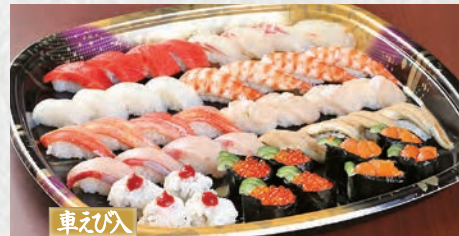
すし盛 蘭 10,000円(税込) 11種44貫 らん