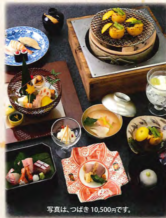
写真は、つばき 10,500円です。