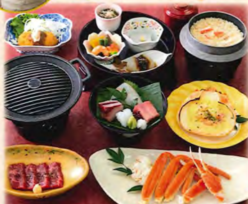
写真は、黒毛和牛鉄板焼 ぼたん 7,500円です。