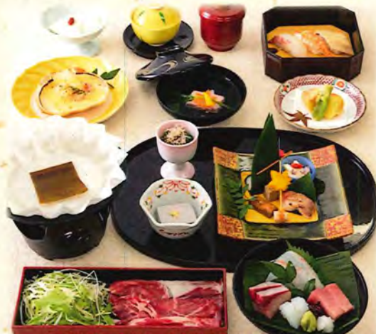
写真は、国産牛しゃぶ小鍋 けやき 7,000円です。

通夜や法事の席で、故人の極楽往生を願って仏前に 故人用として準備する食膳です。会食が済んだら 「おさがり」として家族で残さずいただくことが供養となります。