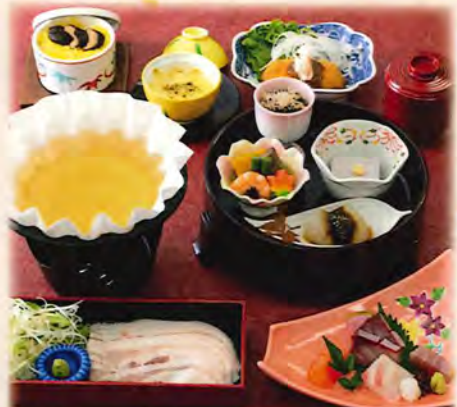
写真は、つゆ豚しゃぶ小鍋 かりん 3,700円です。