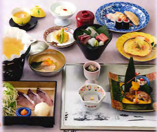
写真は、南禅 9,000円です。