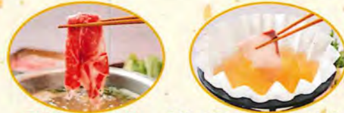
国産牛しゃぶ小鍋 季節の魚しゃぶ(ぶりみぞれ)小鍋