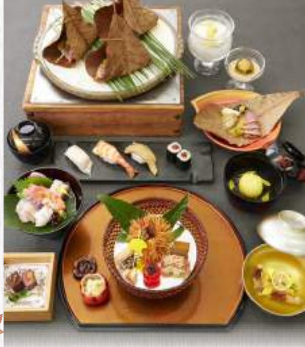
※写真は「懐石料理 きり」です。