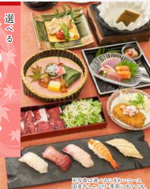
※写真は選べるにぎわいコース国産牛しゃぶ付・季節にぎりです。