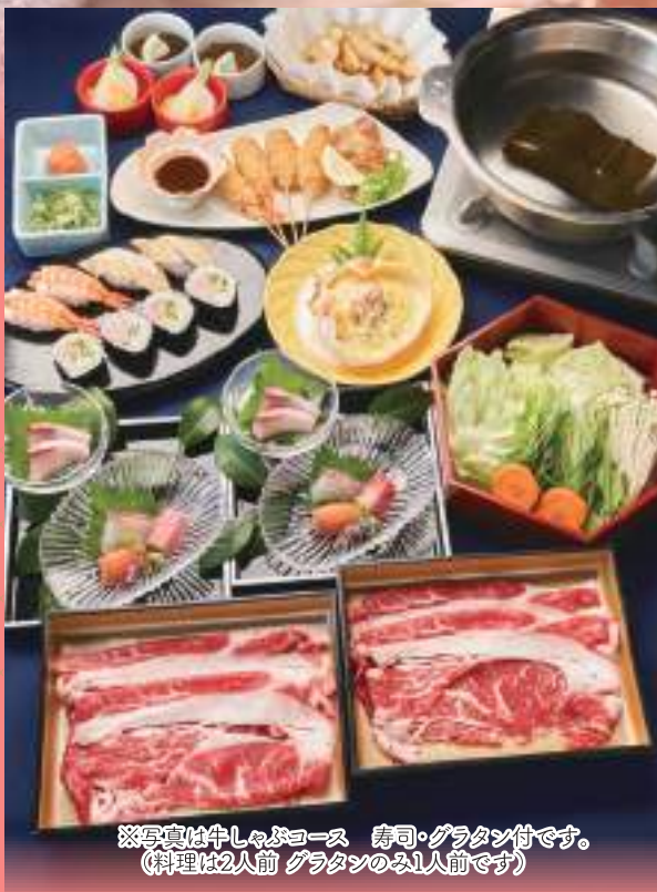
※写真は牛しゃぶコース 寿司・グラタン付です。 (料理は2人前 グラタンのみ1人前です)