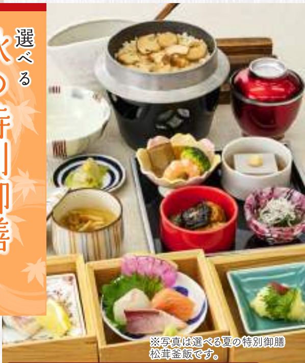
※写真は選べる夏の特別御膳松茸釜飯です。