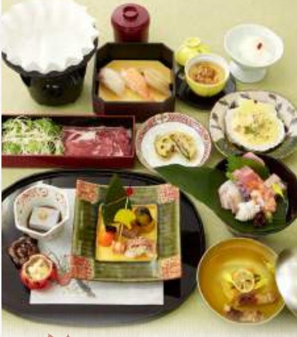
※写真は「かつら」です。