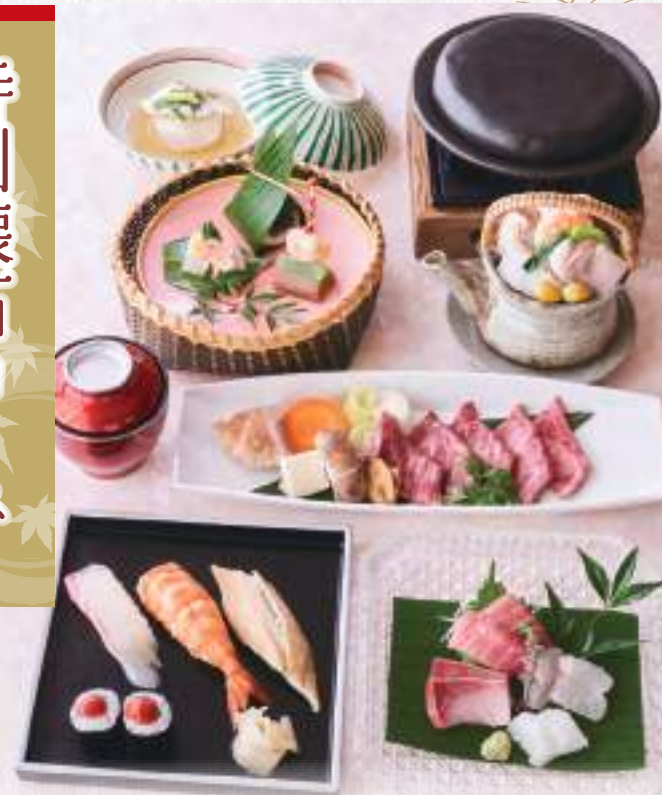
※写真は「臙(おぼろ)」です。