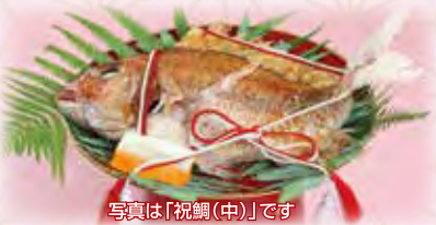
写真は「祝鯛(中)」です