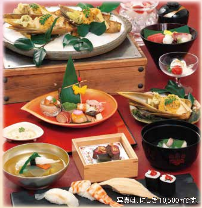
写真は、にしき 10,500円です。