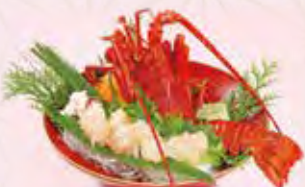
伊勢えび姿造り 8,800円