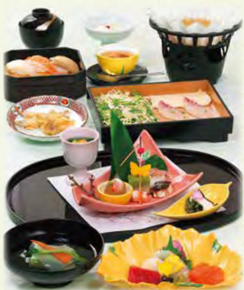
写真は、魚しゃぶかえで5,000円です。