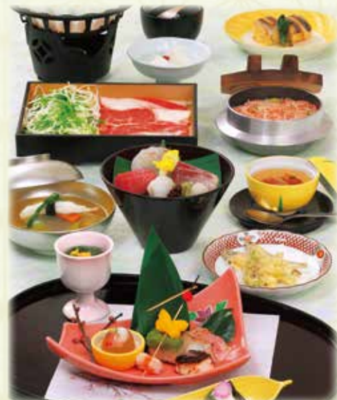
写真は、牛しゃぶかつら 季節釜飯に変更 8,000円です。