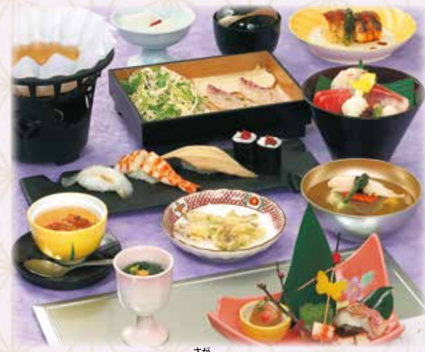
写真は、さが 峨 8,000円です。